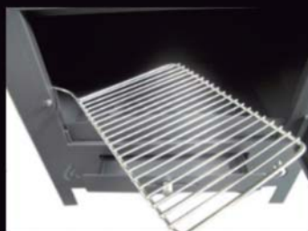
Parrilla de Asados Giratoria Grill Roasted Rotating Churrasqueira Girando